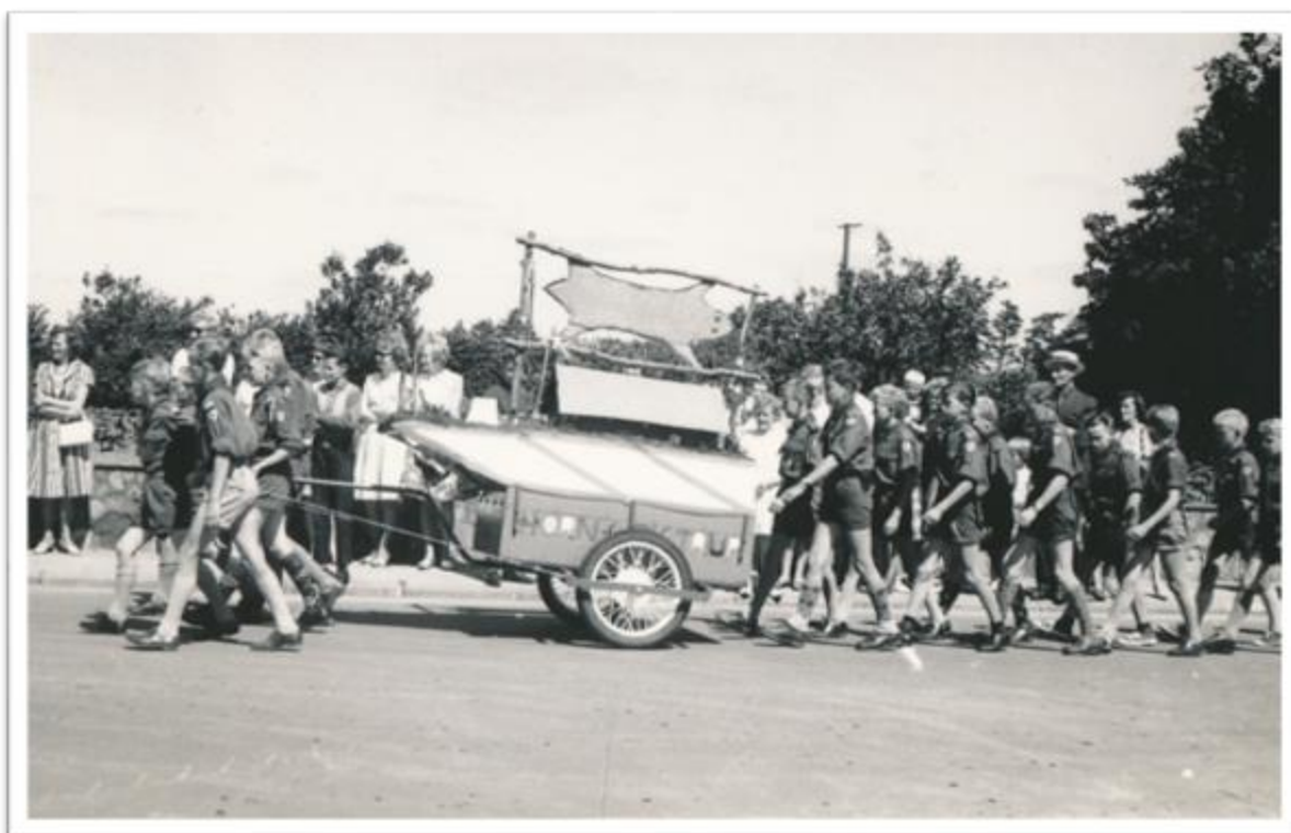
Spejderne med deres kærre ved optoget ved HIF's 60 års jubilæum i 1963