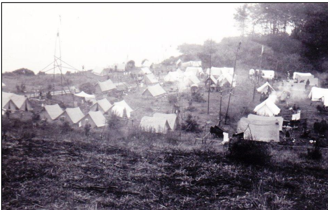
Korpslejren ved Moesgaard strand 1960

Den helt store oplevelse var en stor sommerlejr ved Moesgaard Strand med mange tusinde deltagere. De kørte med toget til Laven, hvor de blev sat af og skulle gå det sidste stykke af vejen til lejren. Undervejs havde de to overnatninger inden de kom frem. De husker, hvordan de trak kærren til toppen af Ejer Bavnehøj og videre til den første lejr ved Tammestrup Gods. Undervejs kom der flere og flere spejdere til, og næste overnatningslejr var meget større. Det var meget fugtigt vejr, så det blev meget pløret. Spejderne fra Horne havde inden lejren lavet en kærre til at transportere deres udrustning på. Mens de fleste havde lavet deres med cykelhjul, som sank ned i pløret, så de selv måtte bære deres udrustning, kørte spejderne fra Horne fint igennem med deres kærre. De havde nemlig sat motorcykelhjul på.