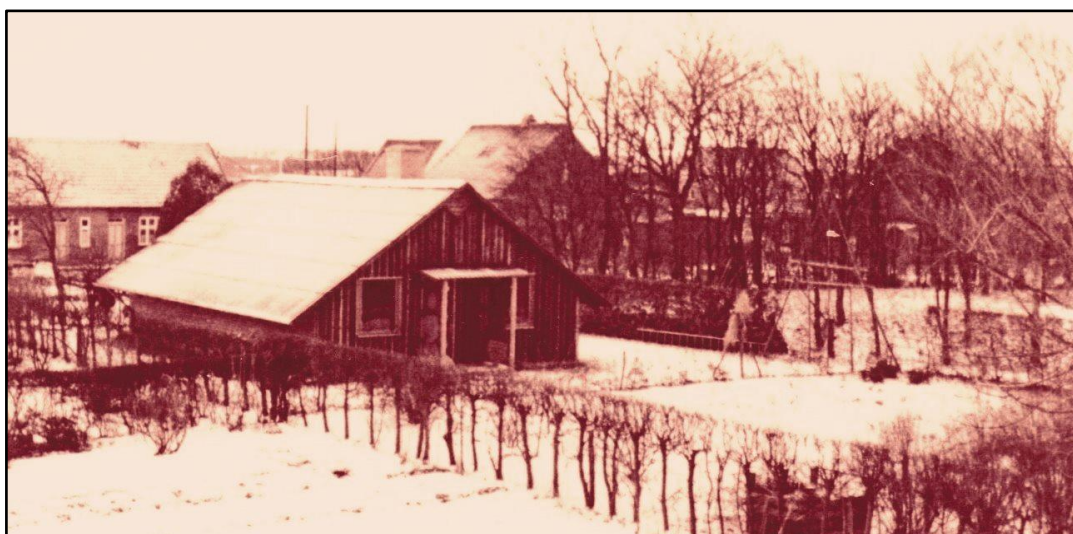
Æ-Hyt i Horne ca. 1965

I 1965 indviede man den nuværende spejderhytte ved stadion. Pengene til byggeriet blev samlet ind i sognet, grunden blev skænket af malermester Jessen, og hytten blev opført ved frivillig arbejdskraft.