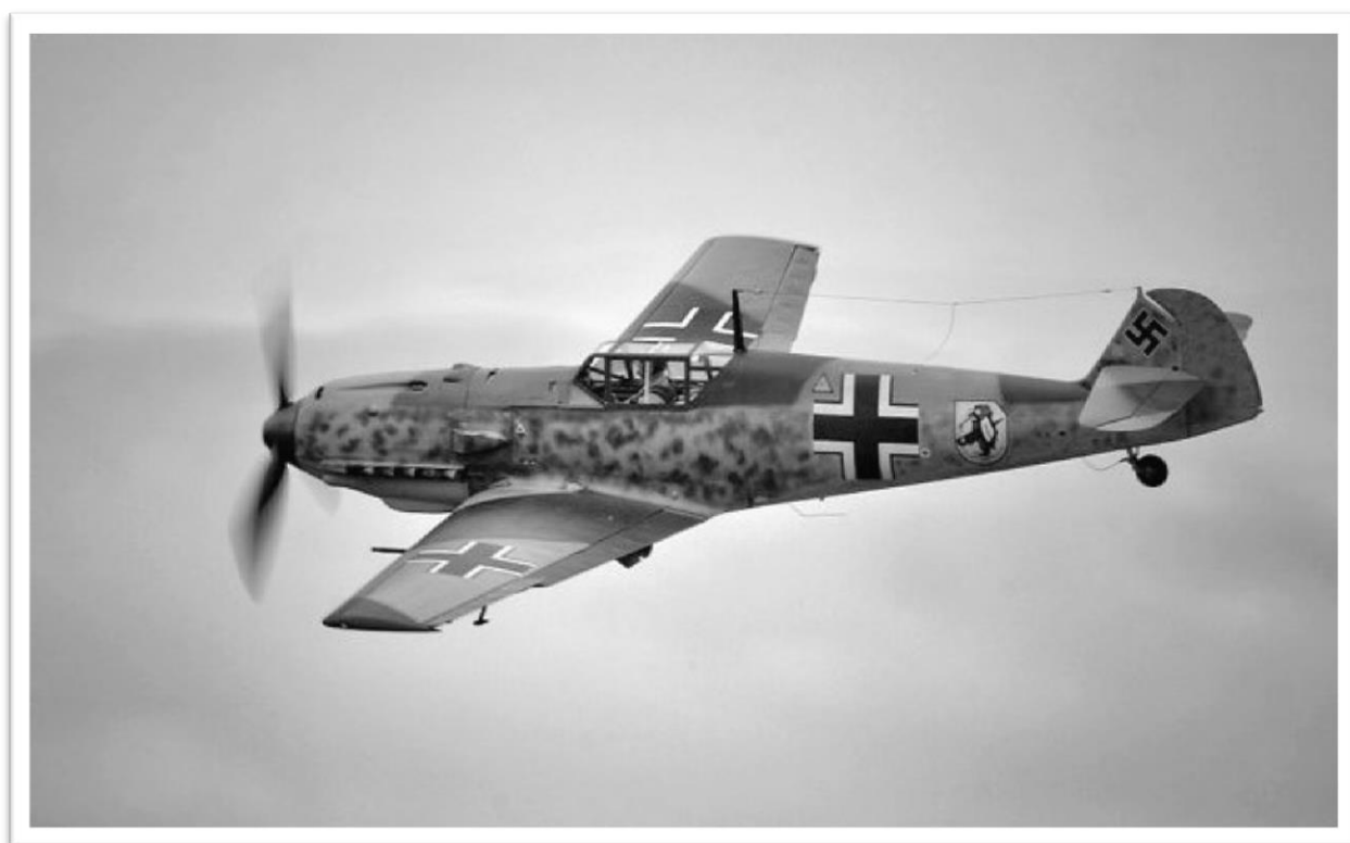
Model af den tyske jager Messerschmitt

Den tyske flyindustri producerede mange fly, og navnet er Messerschmitt. Her er det et én-motors fly, men der blev også fremstillet mange to-motors. Vi må antage, at natjageren over Horne Kær, var en Messerschmitt, som den på billedet, og at det var tale om en mands værk, da Lancaster III fra Royal Australien Air Force blev skudt ned over Birkekær/Horne Kær i Horne.