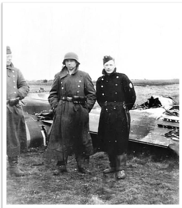
Tyskere og en dansker bevogter flyvraget

Jeg kunne dog ikke komme i nærheden af vraget. Det sværmede med tyske soldater, der begyndte at råbe "Halt", så snart man kom i nærheden. De 2 tyske jagere, der havde skudt den engelske maskine ned, var da kredset bort i sydlig retning.