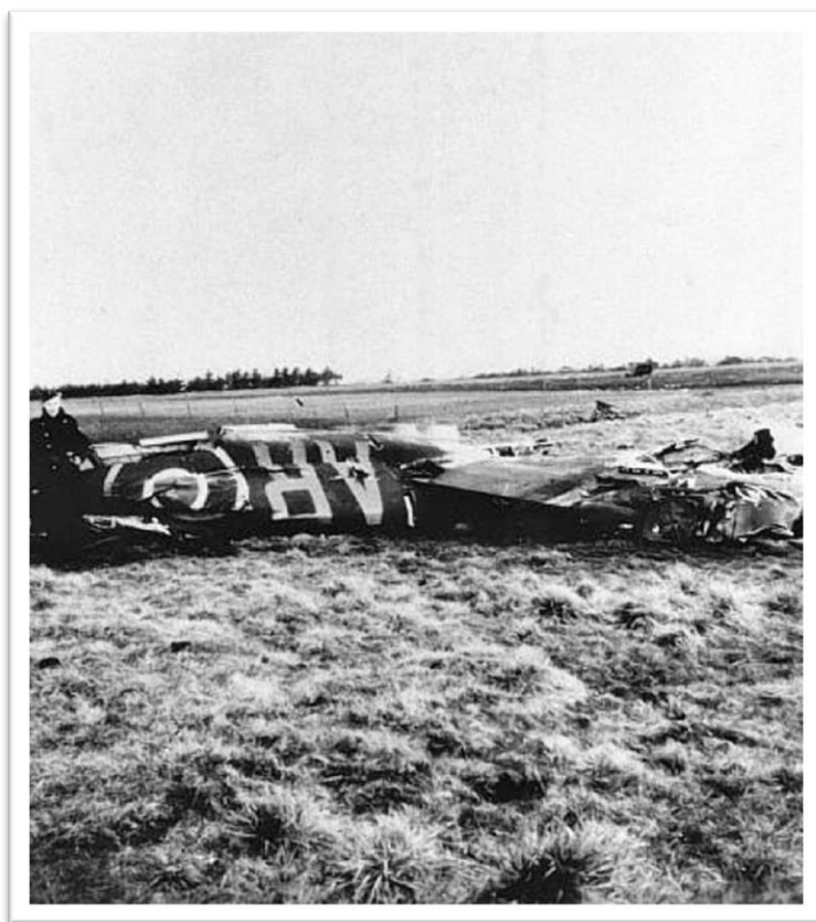
Flyvraget i Horne Kær (Ølgod Museum)

Vi vågnede ved 2 – 3 tiden om morgenen den 14. april (10. april) ved en voldsom flyverlarm og skydning fra øst. Larmen syntes at komme fra retninger lige over vort hus (ejendommen i Asp,) men vi turde selvfølgelig ikke tænde lys. Pludselig hørte vi et altoverdøvende spektakel, og i nogle øjeblikke var vores soveværelse oplyst som på en solskinsdag.