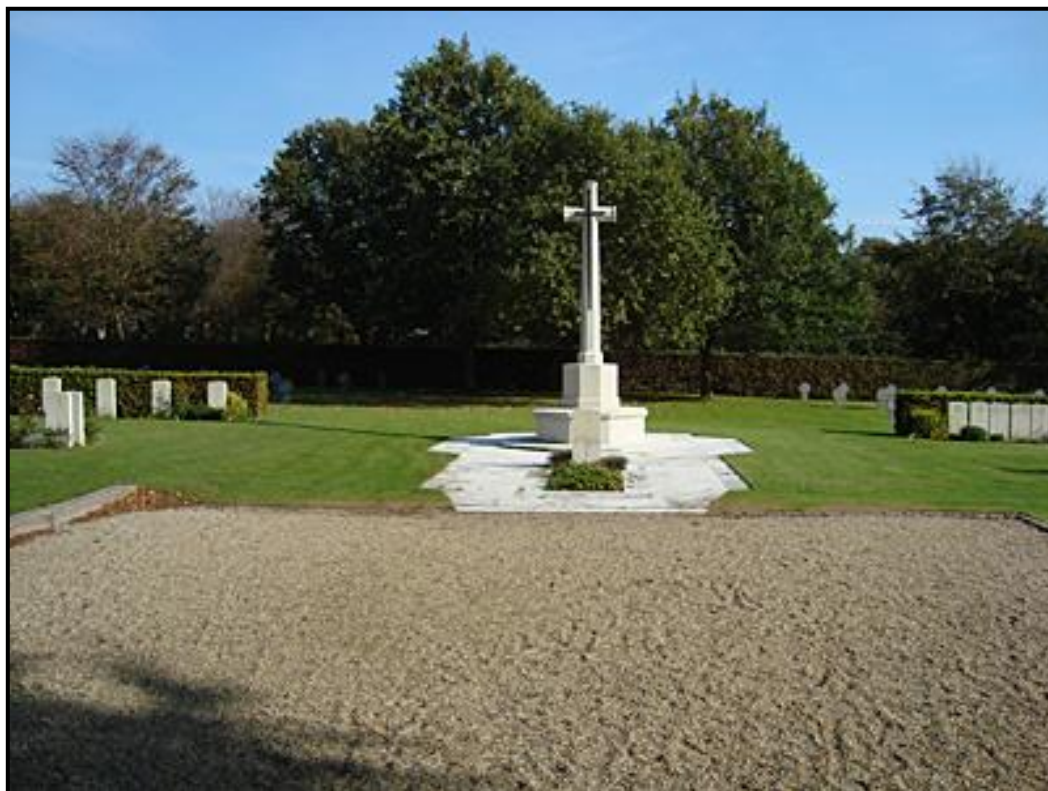
Gravlund Mindepark for faldne soldater 1940 – 1945