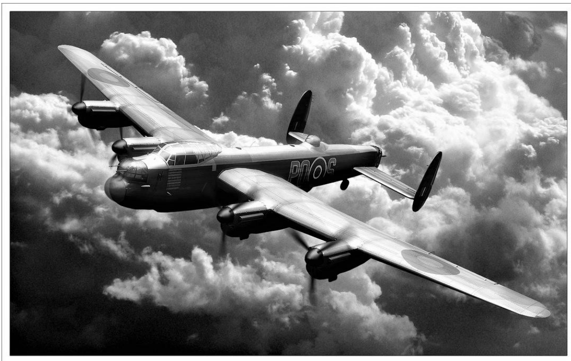
RAAFs Lancaster III JB734