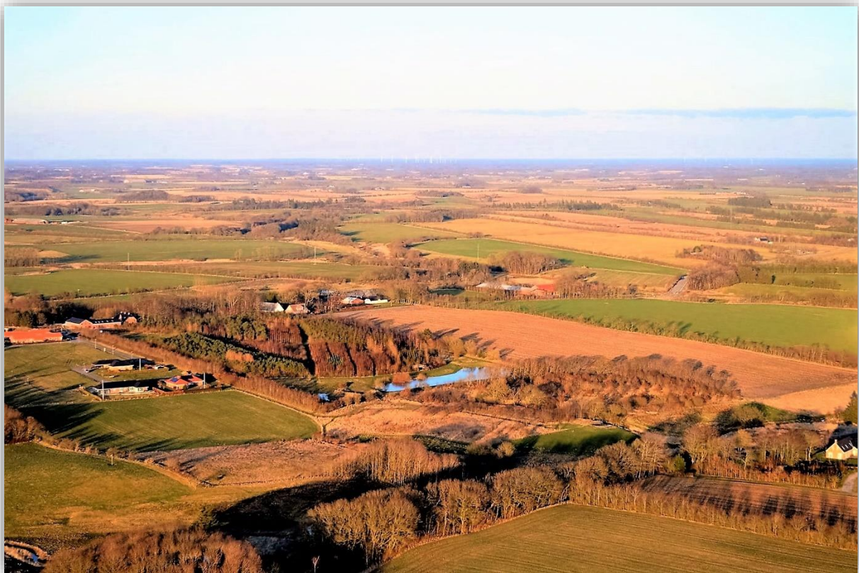
Vikingelunden og Hornelund