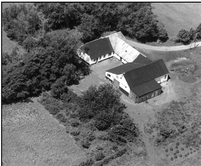
Mit barndomshjem, Bækhusvej 80, Outrup sogn 1947